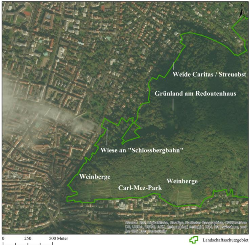
Abb. 1: Luftbild des Schlossbergs in Freiburg mit den behandelten Offenlandlebensräumen.

für Standorts- und Vegetationskunde gewonnen wurden. Frühere Veröffentlichungen aus den Mitteilungen des Badischen Landesvereins für Naturkunde und Naturschutz gehen auf Flora und Fauna des Schlossbergs ein und ermöglichten einen Abgleich mit der heutigen Artenausstattung.