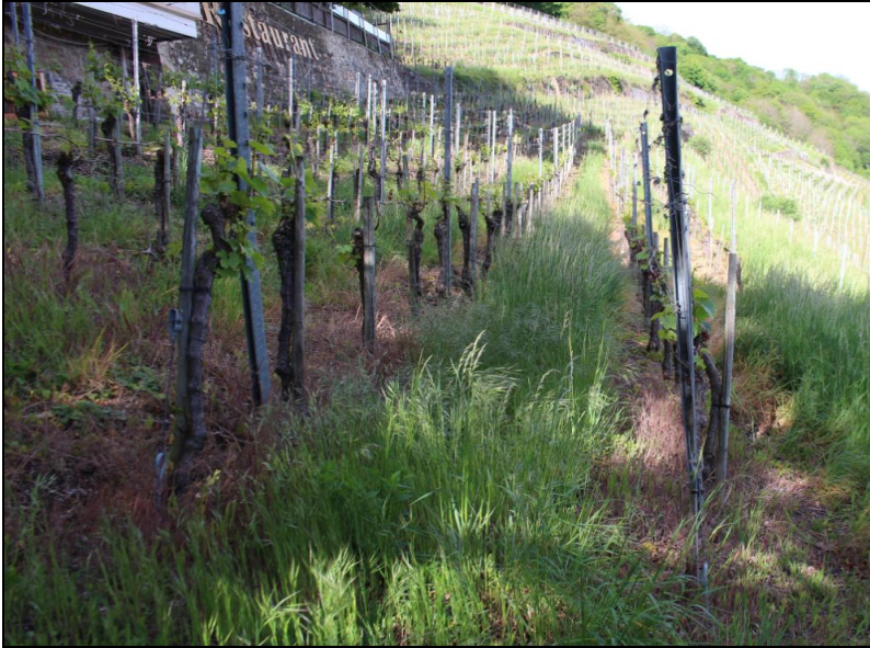
Abb. 3: Der Weinbau beschränkt sich heute auf den Südhang des Schlossbergs. Die Reben sind schwierig zu bewirtschaften. Unter den Rebstöcken ist der Herbizideinsatz zu erkennen. Zwischen den Zeilen nimmt die Taube Trespe ( Bromus sterilis ) im Frühjahr große Flächenanteile ein.