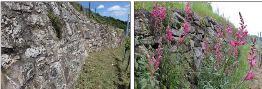
Abb. 5: Verfügte Mauern (links) sind als Lebensraum für Reptilien nicht / bedingt geeignet; eine südexponierte, hohlraumreiche Trockenmauer, hier mit Löwenmäulchen ( Antirrhinum majus ) (Gartenflüchtling), ist als Lebensraum ideal.

Teils sind typische Wiesen-Arten vorhanden wie Wiesen-Flockenblume ( Centaurea jacea ), Feld-Witwenblume ( Knautia arvensis ) und vereinzelt Großer Wiesenknopf ( Sanguisorba officinalis ). Punktuell kommen auch Weidezeiger wie der Besenginster ( Cytisus scoparius ) vor. Feld-Hainsimse