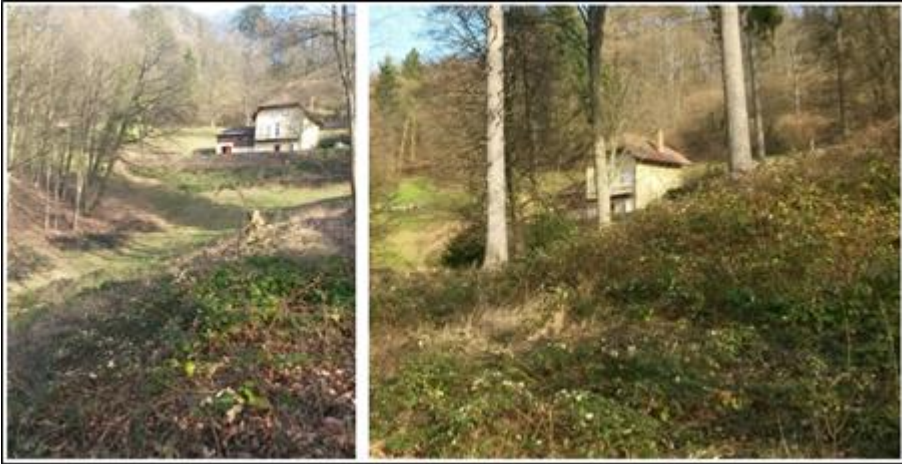
Abb. 6: Das Offenland verbuscht rasch; Situation unterhalb des „Redoutenhauses“ am Westhang des Schlossbergs, 2017. Hier wurde im Sommer zur initialen Bekämpfung der Brombeere großflächig gemulcht.