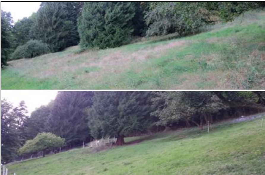
Abb. 7: Foto August 2016 (oben) und August 2017; gut zu erkennen ist die durch die Weidetiere schon nach einem halben Jahr markant herausgestellte „Fraßkehle“, also das Abweiden der Bäume bis auf Äserhöhe am Waldrand, und die abgestorbenen Gräser, die im Vorweidejahr noch flächig vorhanden waren, nach der Beweidung aber fehlen.

Auf Basis der Voruntersuchungen wurde mit Unterstützung des Flächeneigentümers (Caritas Deutschland) ein Lehrforschungsprojekt „Weide am Schlossberg“ initiiert. Seit April 2017 sind fünf Ziegen (Tauernschecken) und drei Schafe (Waldschafe) während der Weidesaison im Einsatz und beweiden neben dem Offenland noch etwa 0,4 ha Wald (Abb. 7).