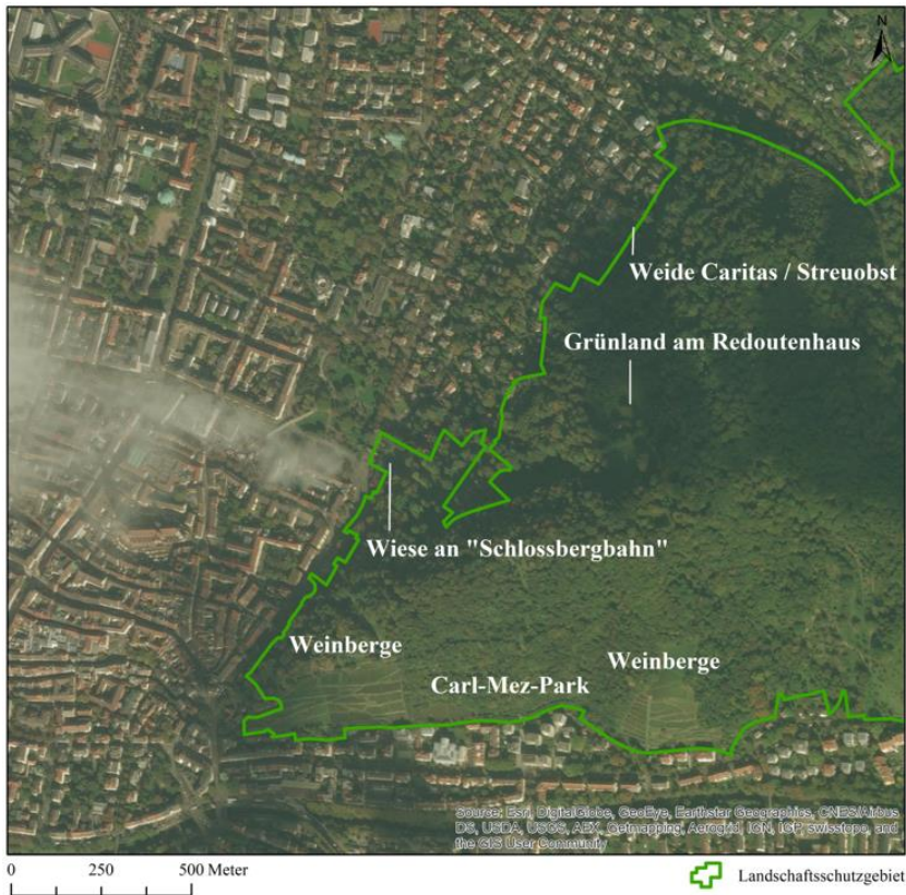
Abb. 1: Luftbild des Schlossbergs in Freiburg mit den behandelten Offenlandlebensräumen

für Standorts- und Vegetationskunde gewonnen wurden. Frühere Veröffentlichungen aus den Mitteilungen des Badischen Landesvereins für Naturkunde und Naturschutz gehen auf Flora und Fauna des Schlossbergs ein und ermöglichten einen Abgleich mit der heutigen Artenausstattung.