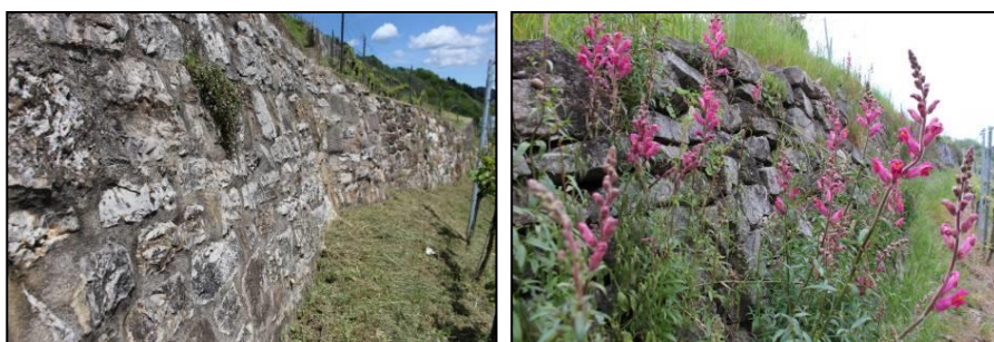
Abb. 5: Verfügte Mauern (links) sind als Lebensraum für Reptilien nicht / bedingt geeignet; eine südexponierte, hohlraumreiche Trockenmauer, hier mit Löwenmäulchen ( Antirrhinum majus ) (Gartenflüchtling), ist als Lebensraum ideal.

Teils sind typische Wiesen-Arten vorhanden wie Wiesen-Flockenblume ( Centaurea jacea ), Feld-Witwenblume ( Knautia arvensis ) und vereinzelt Großer Wiesenknopf ( Sanguisorba officinalis ). Punktuell kommen auch Weidezeiger wie der Besenginster ( Cytisus scoparius ) vor. Feld-Hainsimse