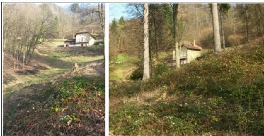
Abb. 6: Das Offenland verbuscht rasch; Situation unterhalb des „Redoutenhauses“ am Westhang des Schlossbergs, 2017. Hier wurde im Sommer zur Bekämpfung der Brombeere erstmalig großflächig gemulcht.